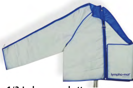
1/2 Jackenmanschette mit 12 Luftkammern rechts mit Bolereo Art.-Nr. 1182