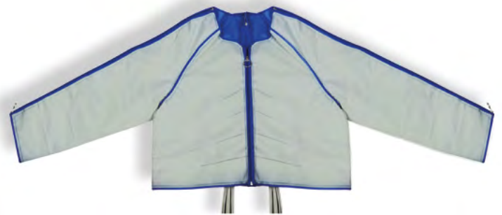
Jackenmanschette mit 24 Luftkammern Art.-Nr. 1180